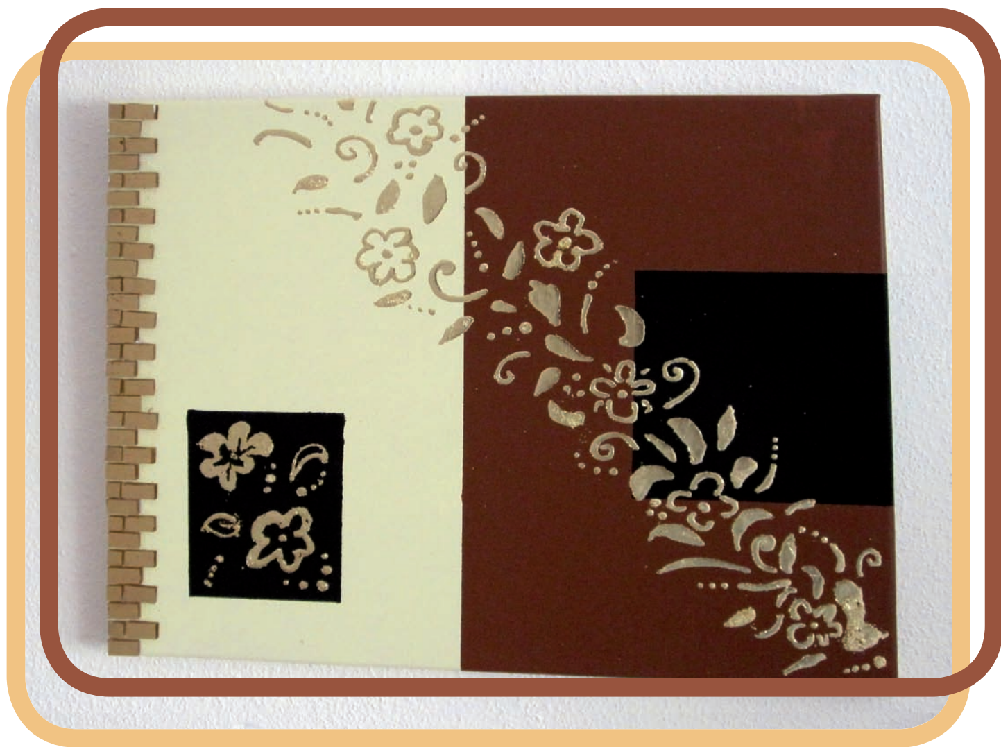
Bild in Braun-gold Optik