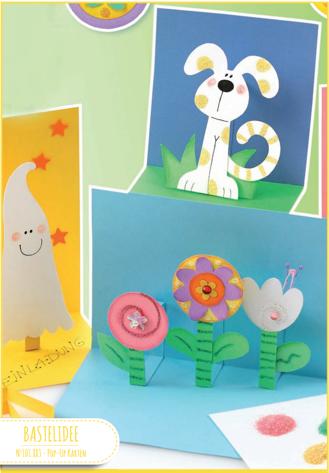
BASTELIDEE N°101.883 - POP-UP KARTEN